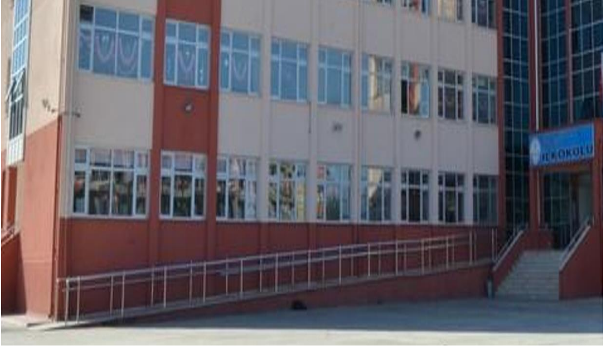
Okulumuz Engelli Rampası