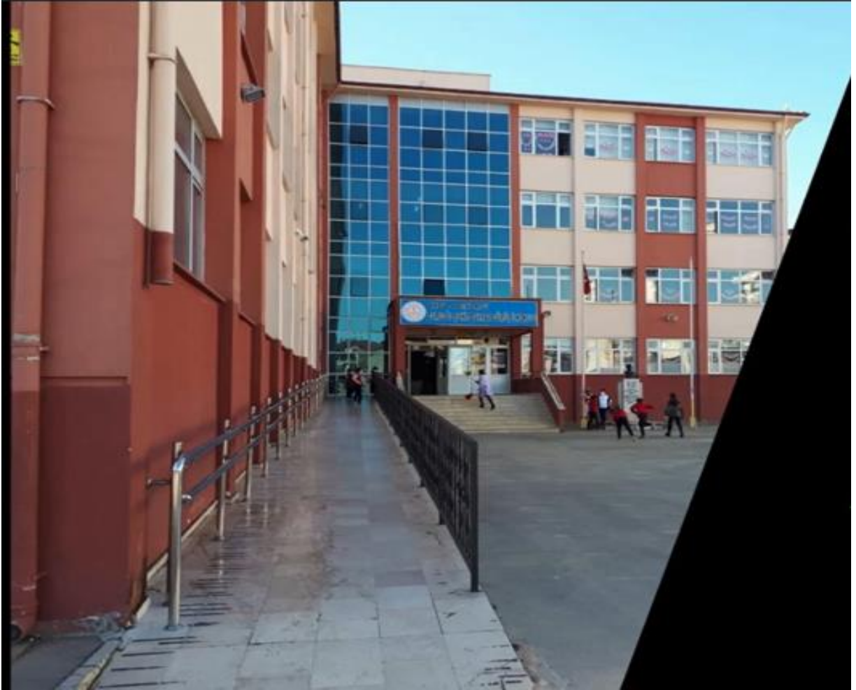
Okulumuz Engelli Rampası