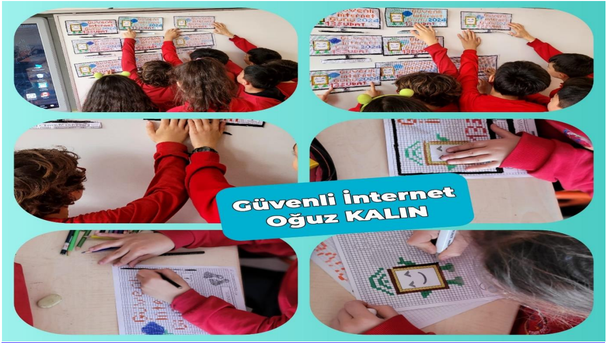
Güvenli İnternet Panosu için etkinlik yapıldı.