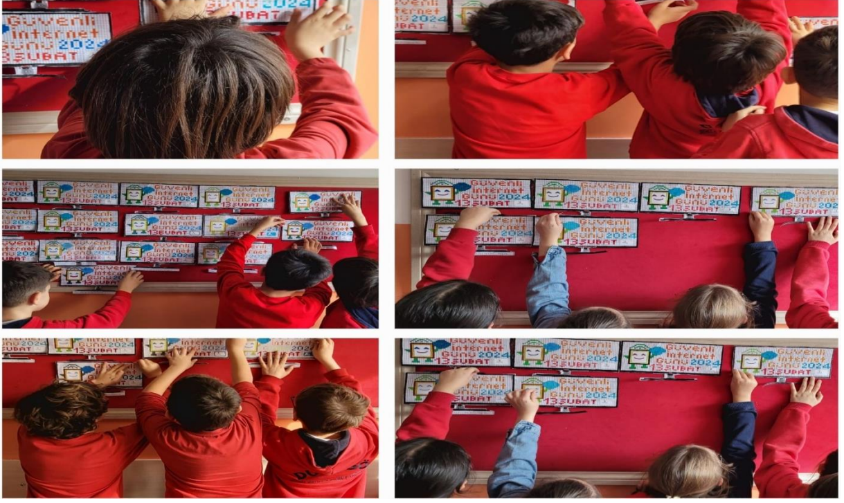
Güvenli İnternet Panosu oluşturuldu.